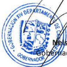
Nelson Martínez Gobernador de Canindeyú

En prueba de conformidad a las cláusulas que anteceden, firman las Partes, en cuatro (4) ejemplares de un mismo tenor y a un sólo efecto, previa lectura y ratificación del contenido en el lugar y fecha consignados precedentemente.