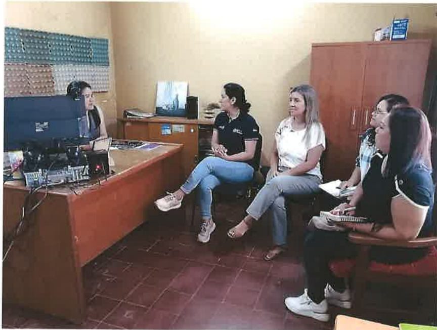
Equipo Logístico e Intendente de Sta. Rosa

Reunión con Referente de CODENI, Equipo de la Estrategia Kunu u y UTGS