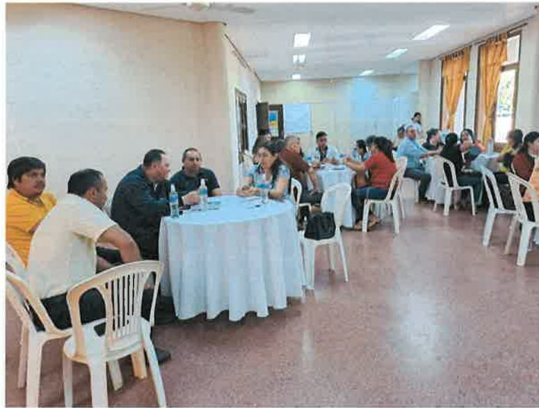
Funcionarios de distintas instituciones participando del Taller