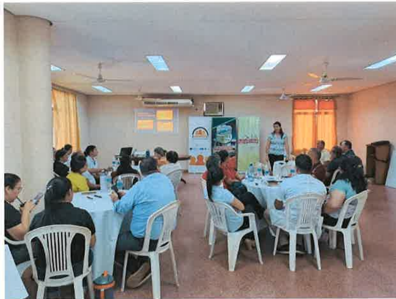
Miembros del Consejo de Educación compartiendo con la plenaria lo trabajado en la mesa.

Misión: "Propiciar la gestión eficiente de los programas y las Políticas Públicas del Gobierno Nacional en el área social para todas las personas, generando procesos de articulación multidimensional".