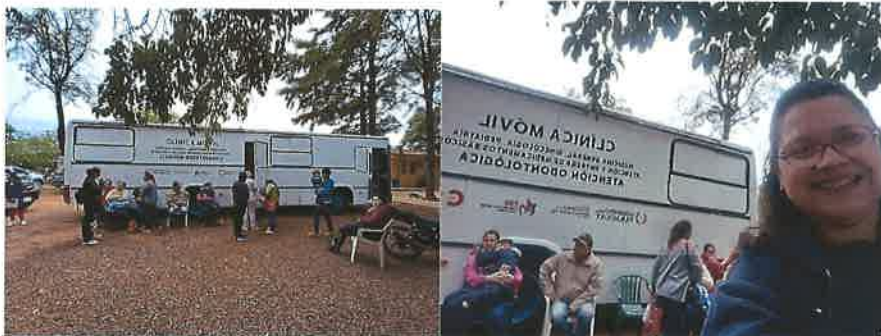
Atención odontológica – Patio del Hospital de Referencia