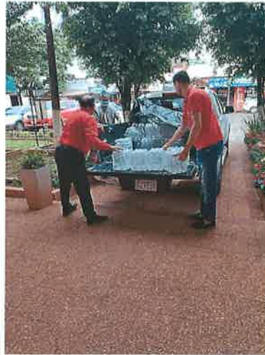
Entrega de agua en la Municipalidad de San Juan de Nepomuceno