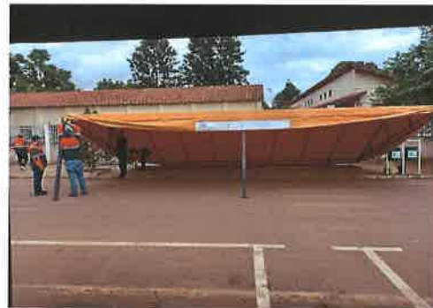
Carpas armadas: 2 en el Hospital de Referencia y otros 2 en la Escuela "Margarita Cabral Centurión"