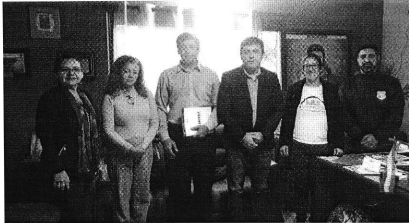
En la oficina del intendente de Alberdi

Elaborado por Rosa González y Víctor López