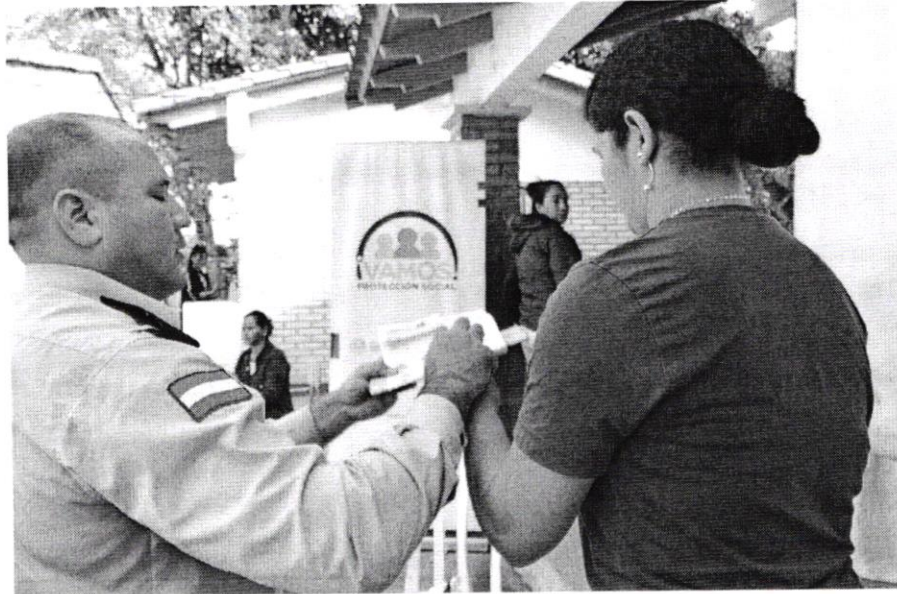
El Departamento de Identificaciones realizando cedula de identidad.