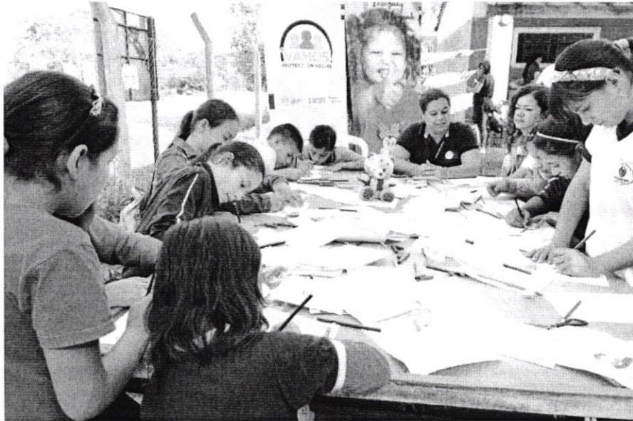
Compartiendo con el MINNA y los niños