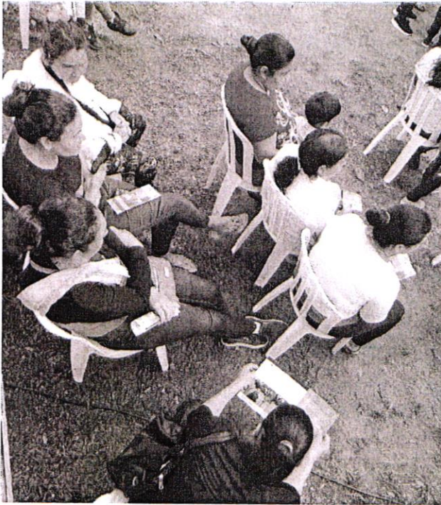
Compartiendo información sobre Vamos, Sistema de Protección Social