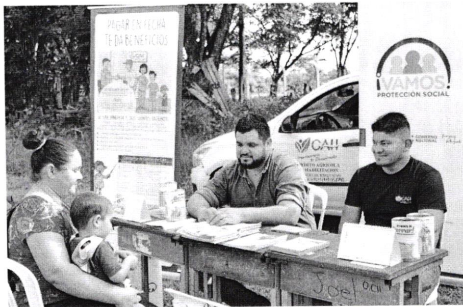
CAH ofreciendo asesoramiento crediticio a las personas.