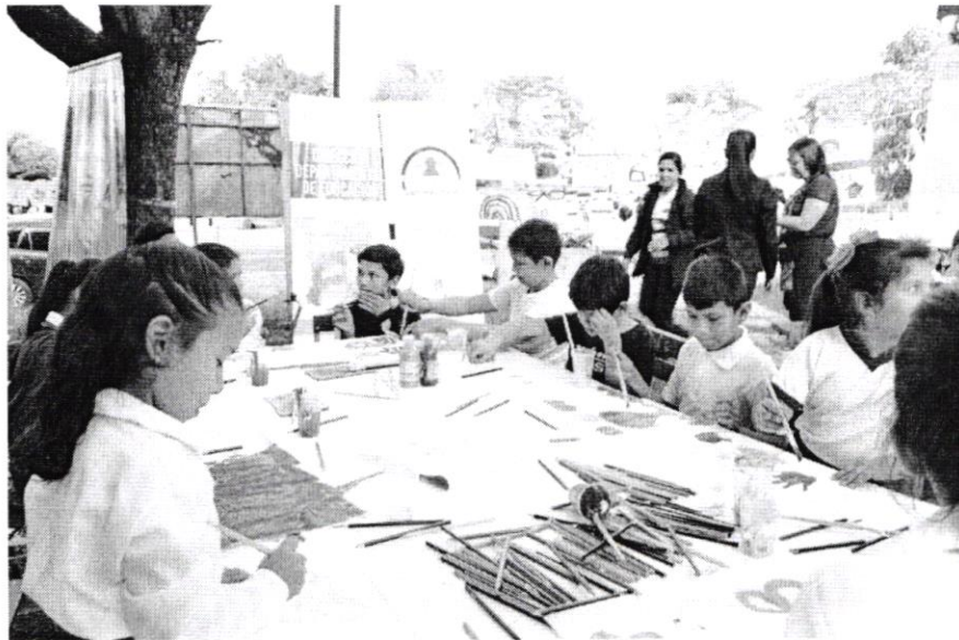
El MEC, las Maestras Mochileras y los niños compartiendo el espacio