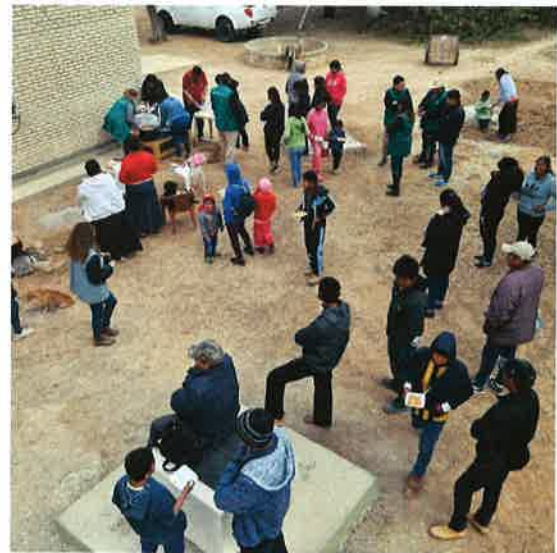
Momentos donde se repartió el almuerzo a los miembros de la comunidad.