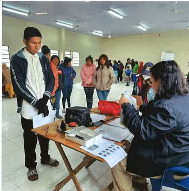
Departamento de Identificaciones del INDI, realización de Cédulas de Identidad.