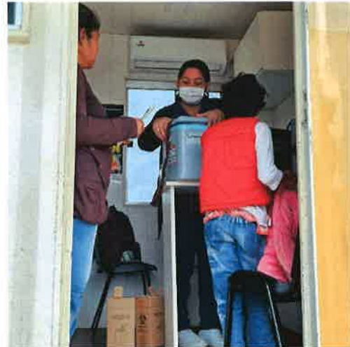
MSPBS – USF Arco Iris zona Montaña con Servicios de Consultas y Vacunación en la Comunidad Indígena San Martín, también estuvieron presente de las comunidades de Santo Domingo y Jesudi.